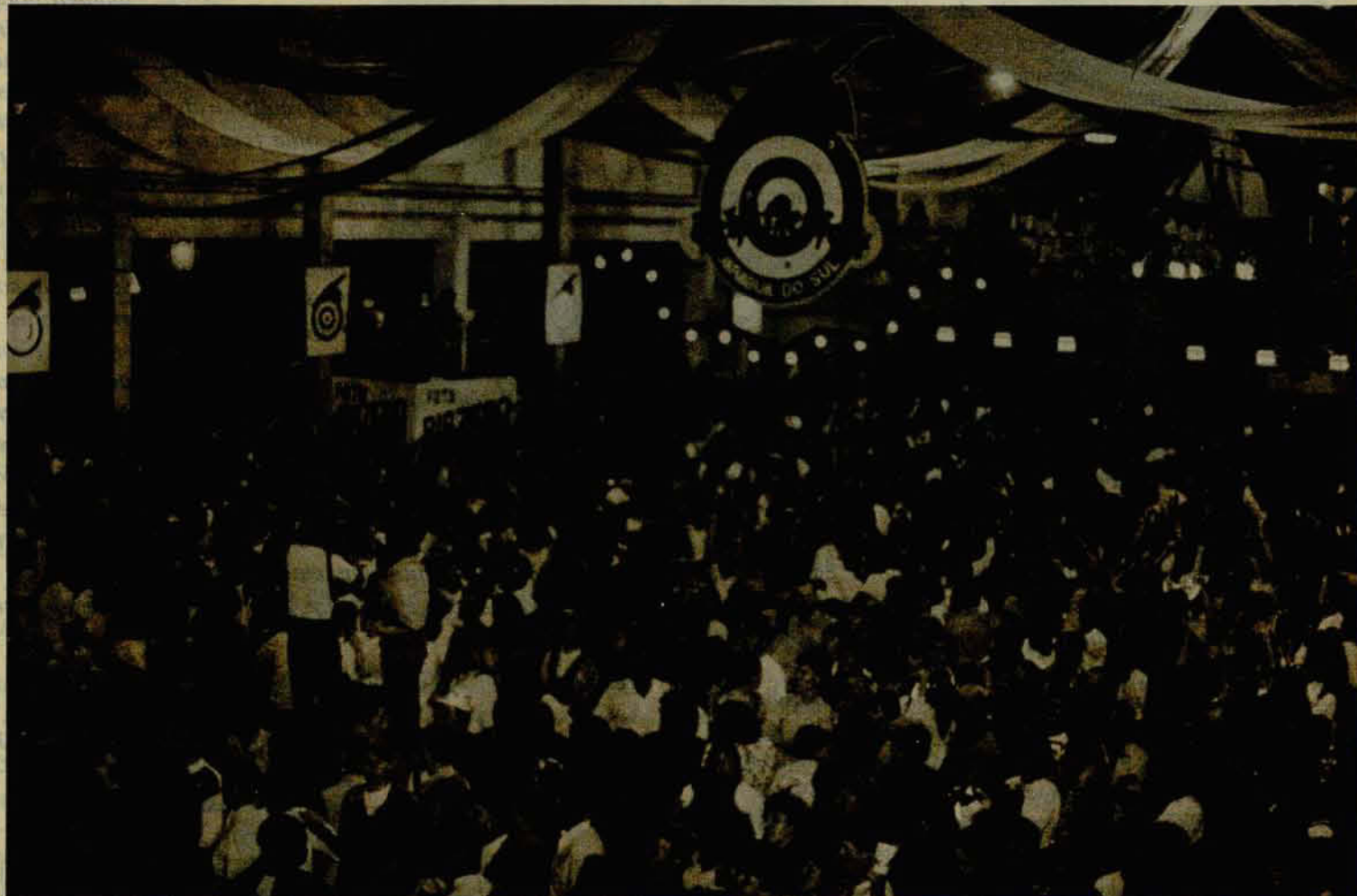
A expectativa é de que mais de 120 mil pessoas participem da festa e consumam cerca de 125 mil litros de chopp, durante os dez dias da festa