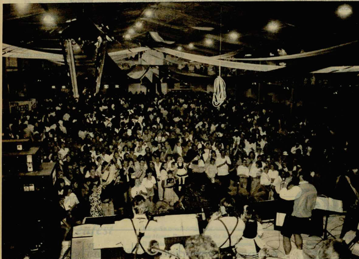
Como em anos anteriores, é assim que deverão ficar os pavilhões do Agropecuário, durante todos os dias da Schützenfest de Jaraguá