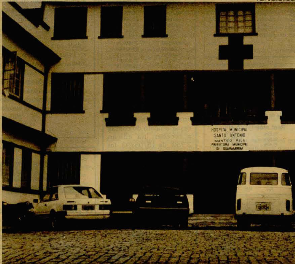
Funcionários e médicos do Hospital Santo Antônio não acreditam nas denúncias

O "Moleque Travesso", joga amanhã à noite a sua chance de firmar a posição de quarto colocado no certame. O Juventus tem uma vitória a mais que o Joinville e nove gols a mais de saldo que o Araranguá. No jogo com o Avaí o time pode assegurar a classificação. Página 7