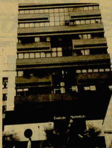
A Adjori-SC, vai ocupar o nono andar do edifício Executive Manhattann

A Associação dos Jornais do Interior de Santa Catarina espera acolher todos os jornais do interior do estado, num verdadeiro mutirão no sentido de que a união