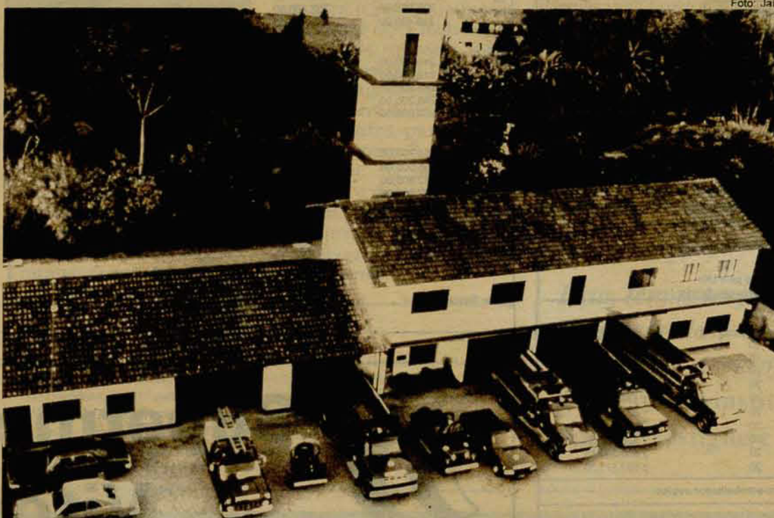
Sede do Corpo de Bombeiros Voluntários de Jaraguá do Sul

Através do deputado estadual, Udo Wagner, está sendo acertado um convênio entre as secretarias da Fazenda e Segurança Pública com o Corpo de Bombeiros Voluntários de Jaraguá do Sul, no valor de Cr$ 1.022.335.416,00, que será repassado em 10 parcelas distintas.