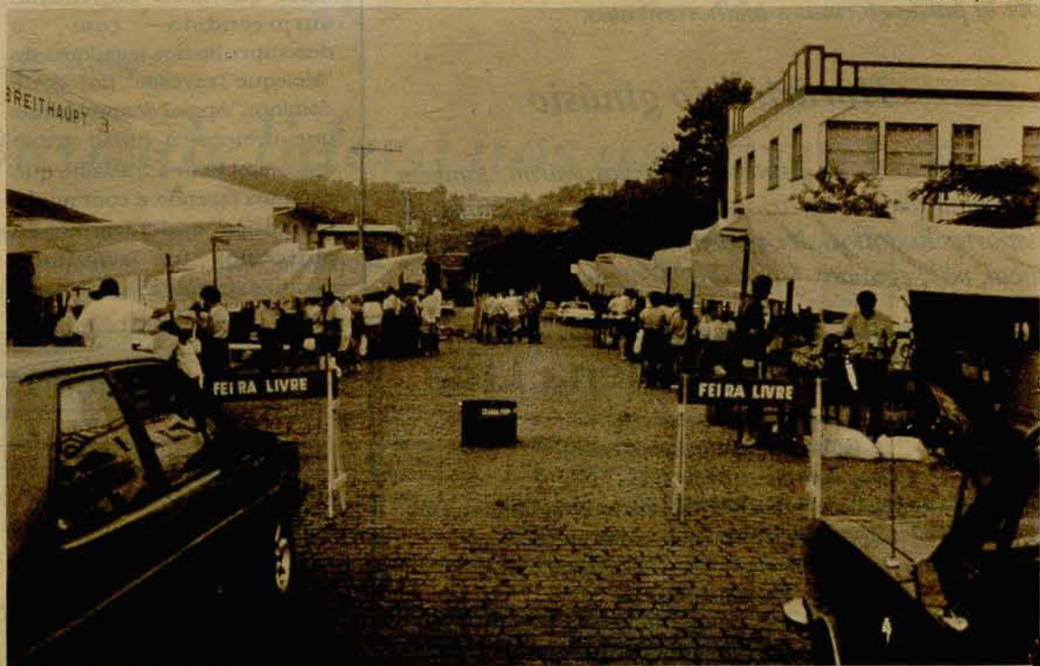
Panorama da nova feira