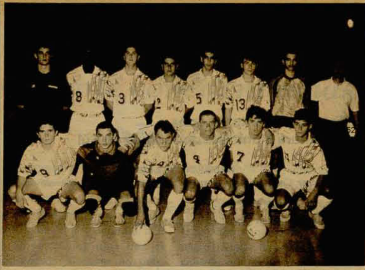
Equipe da ADJ/Malhas Darpe, que jogou ontem com o Palmeiras