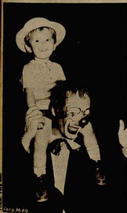
Palhaços: a alegria da criançada

O Carnaval foi fraco em Jaraguá do Sul. O mau tempo e a falta de dinheiro são apontados como principais motivos para o baixo movimento apresentado nos salões e no desfile de rua de sábado (29). Alguns poucos clubes foram exceção e apresentaram um número considerado bom de foliões. Os blocos vencedores do desfile de rua foram: "Em Cima da Hora" (1º lugar) com o tema "Wamp" nas fantasias, em segundo ficou o "Pé Quente" desfilando motivos ecológicos e em terceiro o "Se Segura", com o tema Branca de Neve e os Sete Anões". De prêmio eles receberam respectivamente Cr$ 300.000,00, Cr$ 200.000,00 e Cr$ 100.000,00 da prefeitura Municipal - valor considerado baixo pelos participantes. O desfile programado para a terça-feira - último dia de Carnaval - foi cancelado devido a chuva contínua que caía na cidade durante todo o dia.