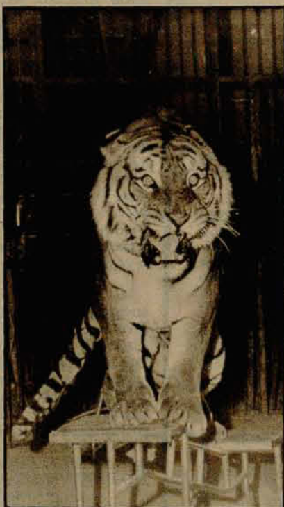
Tigre siberiano é destaque