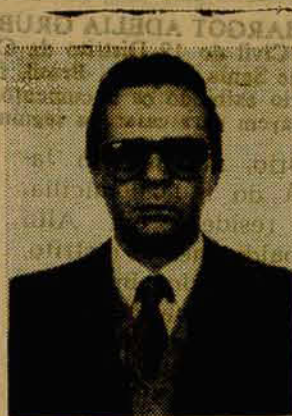
Wander: continuador da obra do pai Parque Malwee.

do avanço de um sistema de vida, dissociado das raízes históricas. Na manhã de 16 de maio, segunda-feira, exatamente um ano de morte do seu idealizador, foi inaugurado o Museu Particular Wolfgang Weege, composto de duas casas típicas e de um galpão de cultura popular, instaladas na entrada do