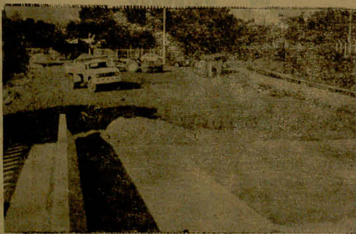
No flagrante, as obras de aterro na nova ponte construída sobre o Rio Itapocu. Mesmo precariamente, a nova ponte já vem dando passagem para veículos e pedestres, desde o último final-de-semana.

Criado pelo Decreto-Lei 565, de 26-03-1934, do Interventor Federal de Santa Catarina, Cel. Aristiliano Ramos, o município de Jaraguá do Sul completa quarta-feira, 52 anos de emancipação político-administrativa. A instalação ocorreu no dia 8 de abril de 1934. Nenhuma comemoração foi programada para marcar o aniversário, haja vista que a tradição jaraguense é a comemoração do aniversário de fundação e não da emancipação.