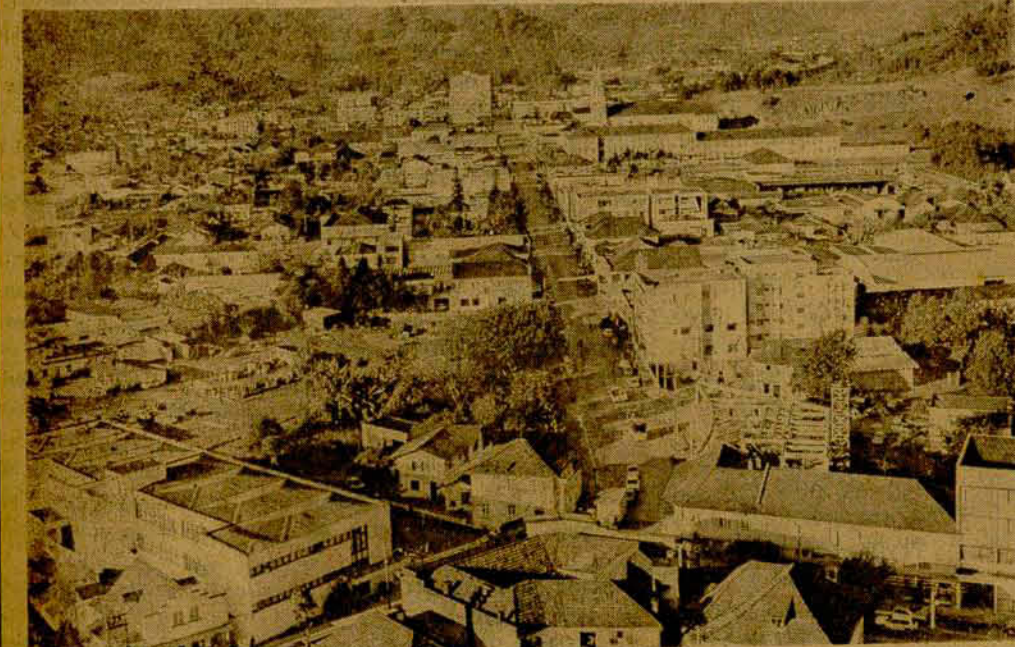
Vista do centro da cidade, visto do 18.º andar do Edifício "Jaraguá".

Esses são, em linhas gerais, o que constitui o nascimento de nosso município, que hoje alcança o seu 106.º