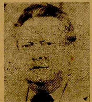
VICTOR BAUER Prefeito Municipal

O culto ao passado e às tradições nos estimulam a continuar o trabalho de conquista de um futuro promissor para nossos filhos, calcados no exemplo de bravura dos fundadores e defensores desta comunidade. A todos os jaraguenses e em especial ao motorista, a nossa homenagem pela passagem deste 25 de julho.