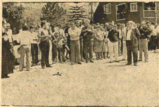
Inauguração da "Bertha Weege"