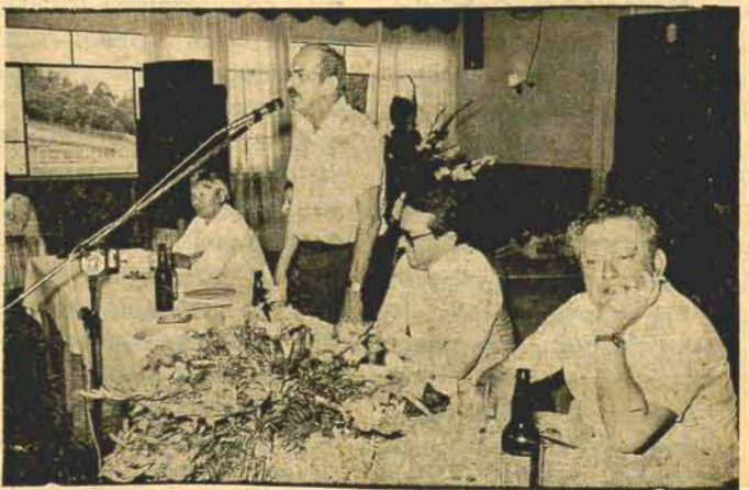
Flagrante da mesa, sábado, na despedida de Bornhausen