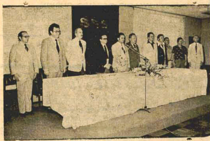
Entrega da cidadania jaraguense a J. Bornhausen

monioso, equilibrado e humano desta cidade. O Governador Este, emocionado e agradecido pelo honroso título, como disse destacou a "grandeza e a bondade" do povo jaraguense, frisando: "Eu tenho a felicidade, eu tenho a oportunidade de podendo ser filho de mais um dos municípios de Santa Catarina, neste caso um dos mais expressivos municípios catarinenses, me colocar ainda mais a serviço desta terra na busca de sua identidade e na sua projeção indispensável para o seu progresso e para o seu futuro". E ao se considerar um otimista, Bornhausen lembrou que acredita nesta terra, "porque acredito na capacidade de sua gente e na diversificação de sua produção". Salientou que Santa Catarina possui condições para demonstrar, como o Brasil também pode, mesmo antes as dificuldades ora vividas, que pelo trabalho irmão de seus filhos, "tenhamos oportunidade de chegar àquele desenvolvimento