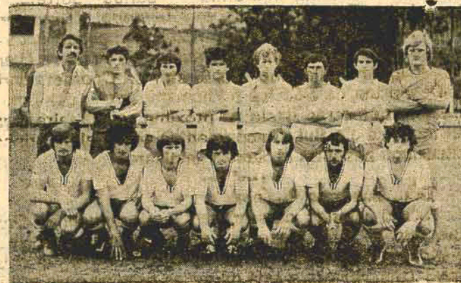
Esporte Clube Figueirense