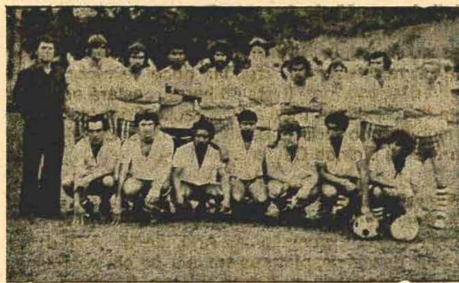
Vila Lenzi Esporte Clube

E os antagonistas voltam a campo neste final-de-semana, decidindo de vez o título do Varjão, Varjão este fadado a ter, infelizmente, neste 1980, sua última edição.