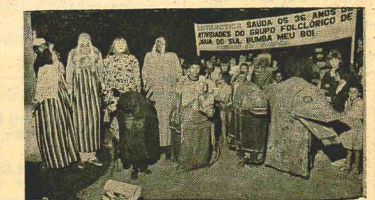
O Boi-de-Mamão na Operação Criança 2