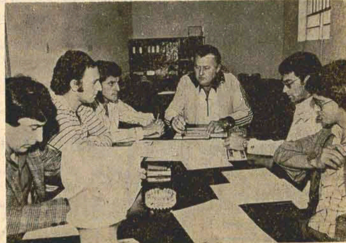
Flagrante do encontro CME/Imprensa.

As dificuldades que há entre outros assuntos foram abordadas no diálogo muito positivo da Comissão Municipal de Esportes com a imprensa especializada e que deverá se repetir, mostrando desta forma ao público, que cobra resultados, o trabalho planejado a médio prazo que vem sendo executado. A CME ofereceu, após a coletiva, almoço num dos restaurantes da cidade.