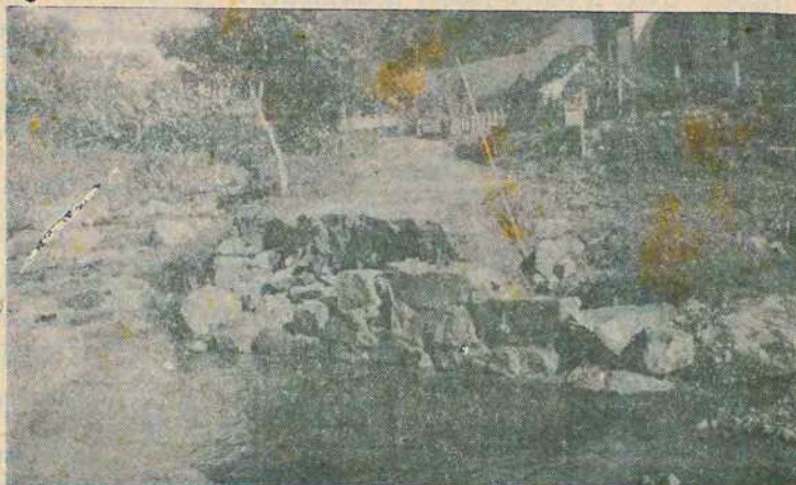
A foto mostra a destruição total de uma ponte no Ribeirão Grande da Luz. A violência das águas nada respeitou. Tristeza e desolação.

Para documentar a extensão dos danos que as cheias de março causaram ao nosso município, estampamos mais dois flagrantes