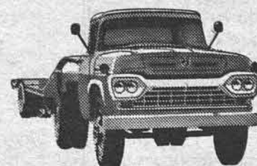
NÔVO SUPER F-600 CAVALO-MECÂNICO

— Venha conhecê-la de perto no seu Revendedor Ford