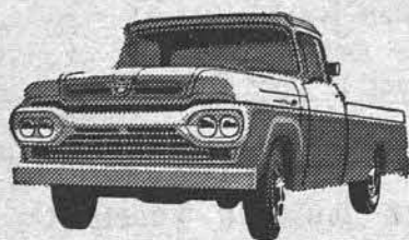
NÔVO SUPER F-100

A ÚNICA* linha completa de caminhões nacionais!