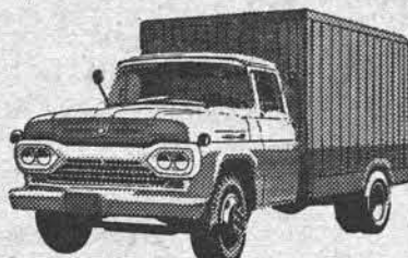
NÔVO SUPER F-350