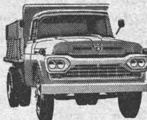
NÔVO SUPER F-600