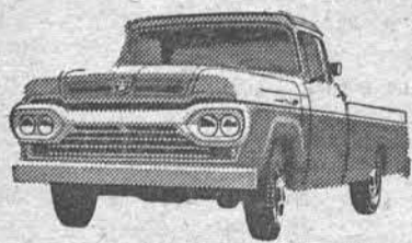
NÓVO SUPER F-100

A ÚNICA* linha completa de caminhões nacionais!