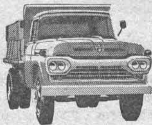
NÓVO SUPER F-600