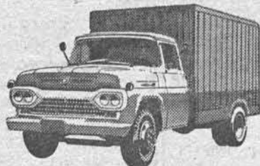
NÓVO SUPER F-350