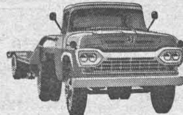
NÓVO SUPER F-600 CAVALO-MECÂNICO

— Venha conhecê-la de perto no seu Revendedor Ford