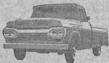
NÓVO SUPER F-100

A ÚNICA* linha completa de caminhões nacionais!