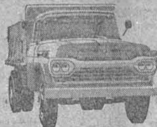
NÓVO SUPER F-600