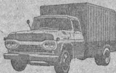
NÓVO SUPER F-350