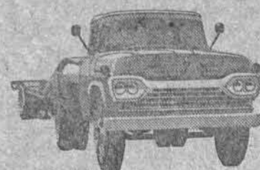
NÓVO SUPER F-600 CAVALO-MECÂNICO

—Venha conhecê-la de perto no seu Revendedor Ford