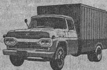
NÓVO SUPER F-350