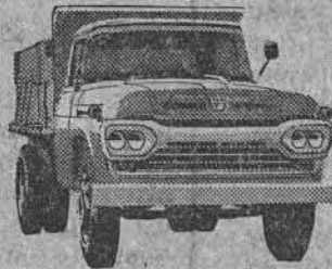
NÓVO SUPER F-600