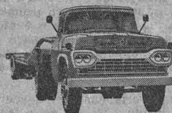
NÓVO SUPER F-600 CAVALO-MECÂNICO

— Venha conhecê-la de perto no seu Revendedor Ford