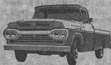
NÓVO SUPER F-100

A ÚNICA* linha completa de caminhões nacionais!