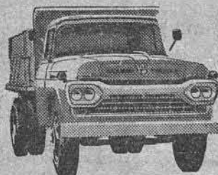
NÓVO SUPER F-600