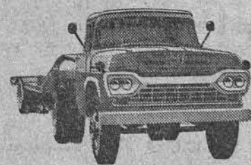
NÓVO SUPER F-600 CAVALO-MECÂNICO

—Venha conhecê-la de perto no seu Revendedor Ford