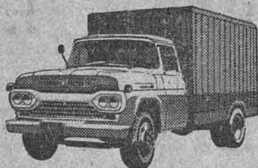
NÓVO SUPER F-350