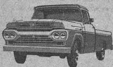
NÓVO SUPER F-100

A ÚNICA* linha completa de caminhões nacionais!