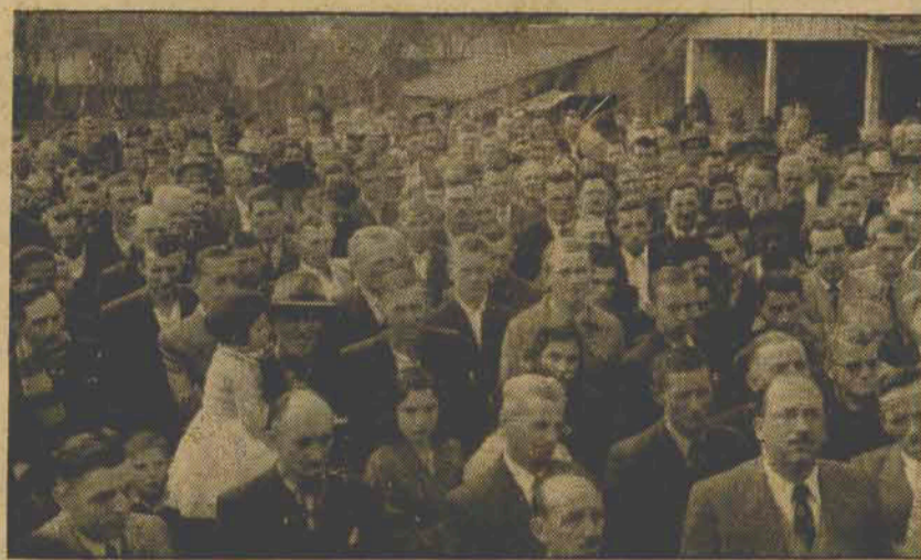
Flagrante da assistência de uma das últimas Exposições da Associação Rural

a pujante classe rúrcola jaraguense, por mais este invulgar empreendimento de repercussão intermunicipal e inter-estadual, na evidencição máscula de nosso dinamismo, dos homens da agricultura, da pecuária, da avicultura e do nosso trepidante