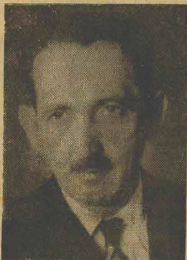
SR. PLINIO SALGADO

Falando a um vespertino da Capital Federal, o sr. Plinio Salgado manifestou seus receios de que uma disputa sômente em tôrno de nomes, gerando conhecidos prejuizos personalistas, seja capaz de tumultuar a vida do País, com graves repercussões até em sua segurança. Considera que os partidos devem apresentar programas, na próxima eleição, conciliando as tendências conservadoras da Nação com as aspirações reformistas das massas populares. Salienta que nem o Marechal Teixeira Lott, sem um programa claro e objetivo, seria capaz de derrotar o sr. Jânio Quadros, que estaria empolgando as massas populares com um estilo de penetração tipicamente baseado na técnica dos "slogans", dirigidos ao subconsciente das multidões, sempre prêsa fácil dos homens carismáticos. Quanto ao seu partido, vai elaborar um programa, para, tendo-o como base, propor o pronunciamento dos candidatos. Os integralistas não participarão, de nenhum modo, de uma luta personalista, prejudicial à Nação.