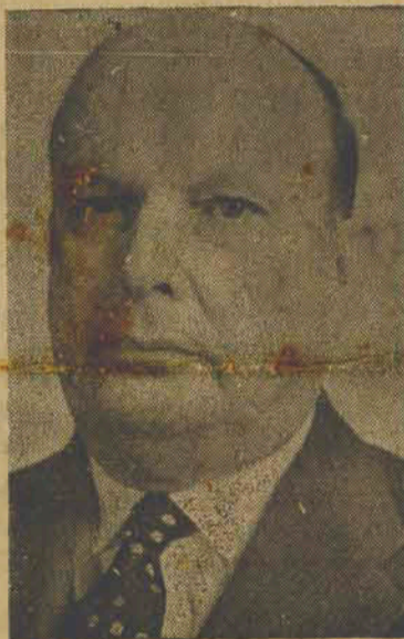
Governador Heriberto Hülse

Nesses encontros com os integrantes da alta administração federal, o Governador Heriberto Hülse tratou de assuntos de alto interesse para a administração de Santa Catarina. Também é de ressaltar, que o Governador recebeu várias visitas de parlamentares catarinenses, tendo, em companhia do senador Irineu Bornhausen, estado em palestra com o Presidente da Câmara Federal, ocasião em que foram ventilados os assuntos relativos à Mensagem que transita por aquela Casa do Congresso Nacional constituindo a Siderúrgica do sul de Santa Catarina.