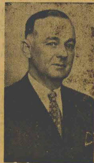
Senador Irineu Bornhausen

de Curitiba, a lúcida comitiva do Senador Bornhausen foi recepcionada com banquete nas localidades de Campos Novos, Joaçaba, Faxinal dos Guedes, Xanxerê, São Domingos e Xaxim.