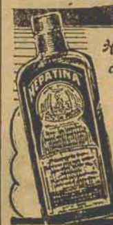
Hepatina N. S. da Penha, que contém Extrato Hepático concentrado, normaliza as funções do fígado.