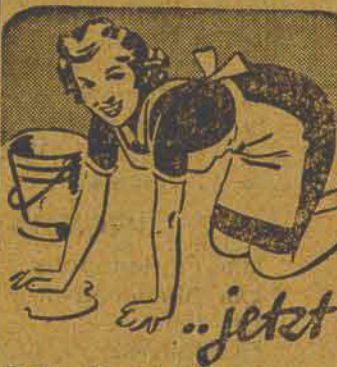
Die Hausfrau, die Nivea nimmt, hat keine "Haushaltshände". Ihre Haut bleibt stets geschmeidig. Wie gut, daß es Nivea gibt!

Unter dem Titel "Getulio Vargas, Blut und Glorie eines Volkes" beendet die brasiliansische Filmgesellschaft Maristela einen Film, der das Leben und die Taten des ehemaligen Diktators und spaeteren Bundespräsidenten Getulio Vargas schildert.