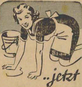
Die Hausfrau, die Nivea nimmt, hat keine »Haushaltshände«. Ihre Haut bleibt stets geschmeidig. Wie gut, daß es Nivea gibt