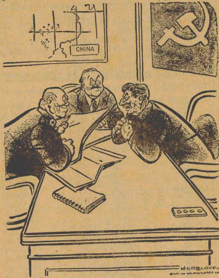
EXTRAIDO DO THE WASHINGTON POST, JORNAL DE WASHINGTON, D.C., E.U.A

«SÃO QUINHENTOS MILHÕES-- QUE PODEMOS SACRIFICAR»