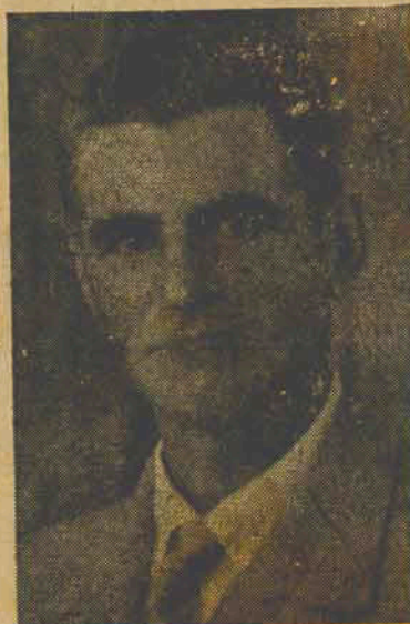
Otaviano Tissi Líder da UDN