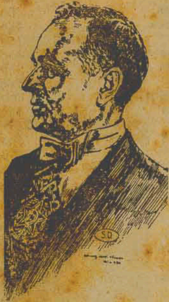
Getúlio Vargas Presidente da República

Dia 31, último, o povo de Jaraguá do Sul viveu um de seus dias memoráveis, de intenso júbilo e exaltação cívica