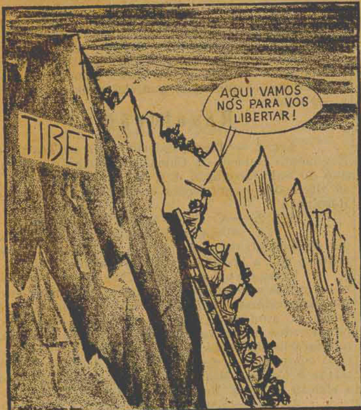
EXTRAÍDO DO "THE SAN FRANCISCO CHRONICLE", JORNAL DIÁRIO DE SÃO FRANCISCO DA CALIFÓRNIA E.U.A.

"Aqui vamos nós para vos libertar" gritaram os comunistas chineses, que sobem por uma escada até os montanhosos picos do Tibet.