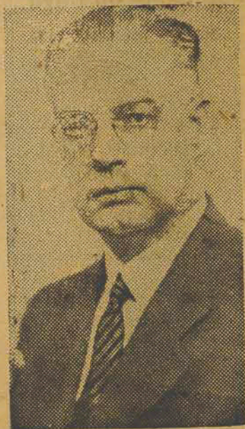
Brigadeiro Eduardo Gomes