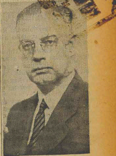
Brigadeiro Eduardo Gomes

Em memorável manifestação à Nação Brasileira o sr. Prado Kelly illustre e digno presidente da UDN, lança oficialmente a candidatura do Brigadeiro Eduardo Gomes e a recomenda para ser consagrada na Convenção do Partido a 12 de Maio. Com esta atitude, afasta-se a UDN do acordo interpartidário que vinha sendo tentado para a candidatura única. O lançamento da candidatura do Brigadeiro, nos deixa claro, que a União Democrática Nacional, como partido de oposição que é, disputará a presidência da República neste ano de 1950 com a mesma dignidade com que disputou o pleito de 1945.