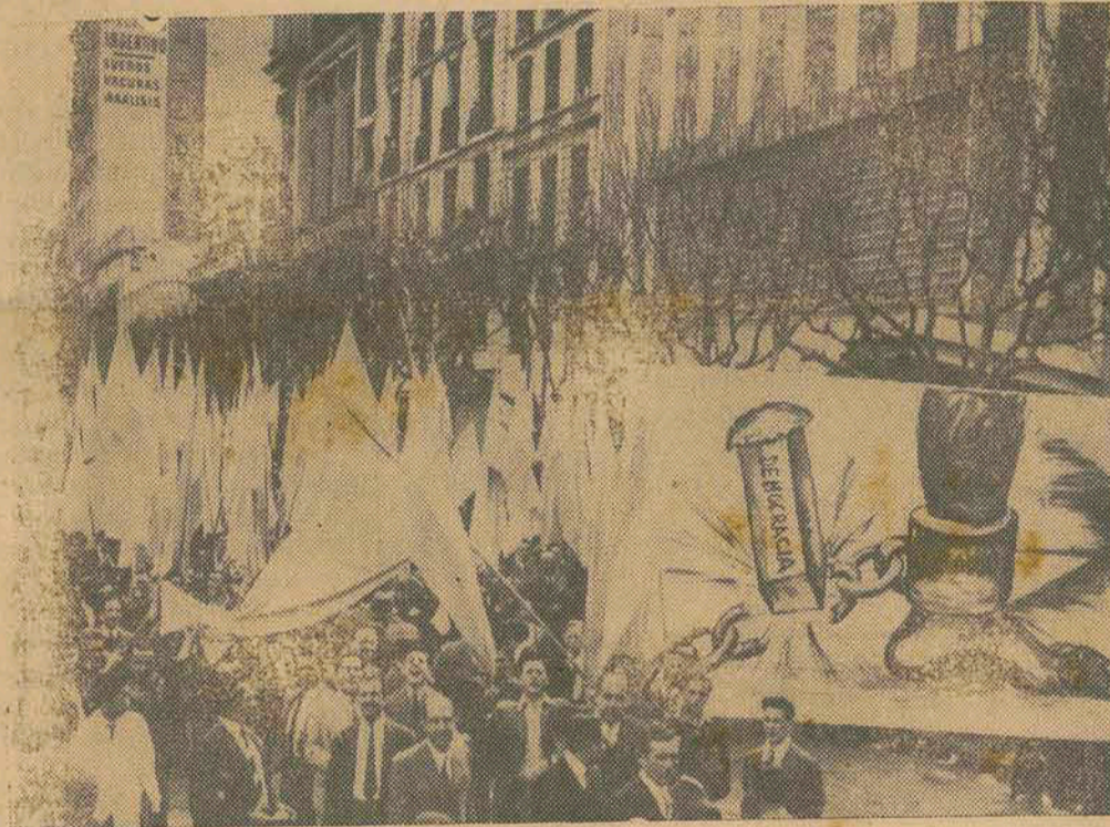
Uma multidão composta de quase meio milhão de cidadãos argentinos marchando pelas ruas de Buenos Aires em desfile em prol da constituição e da democracia. Pouco depois deste desfile, o governo argentino decretou "Estado de Sítio".