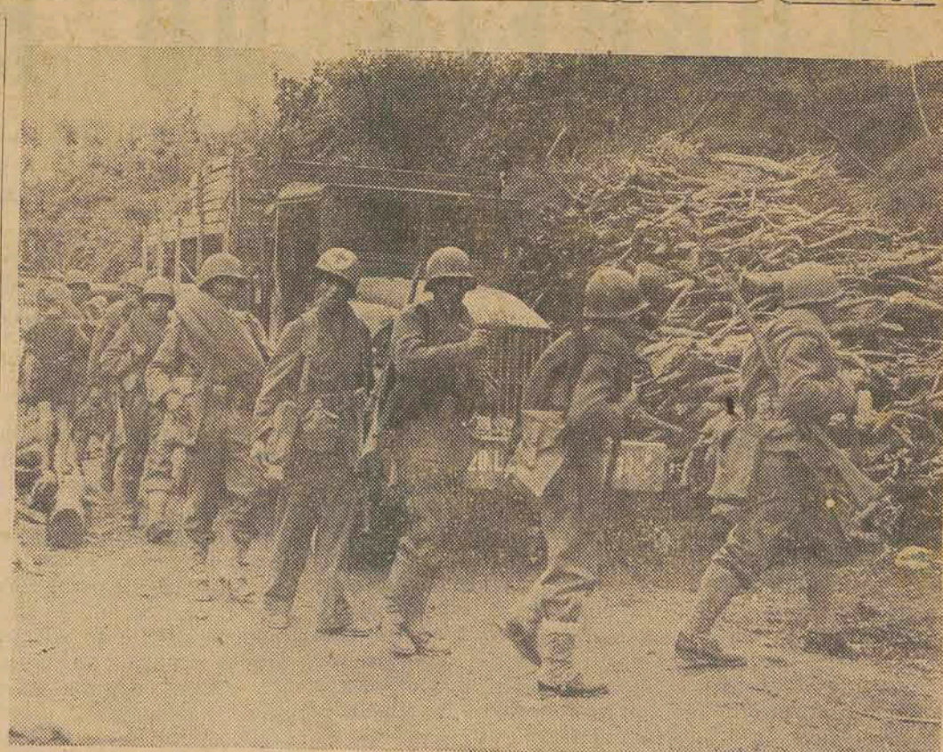
Forças brasileiras atacam os nazistas na Italia (Serviço de Informações do Hemisfério)