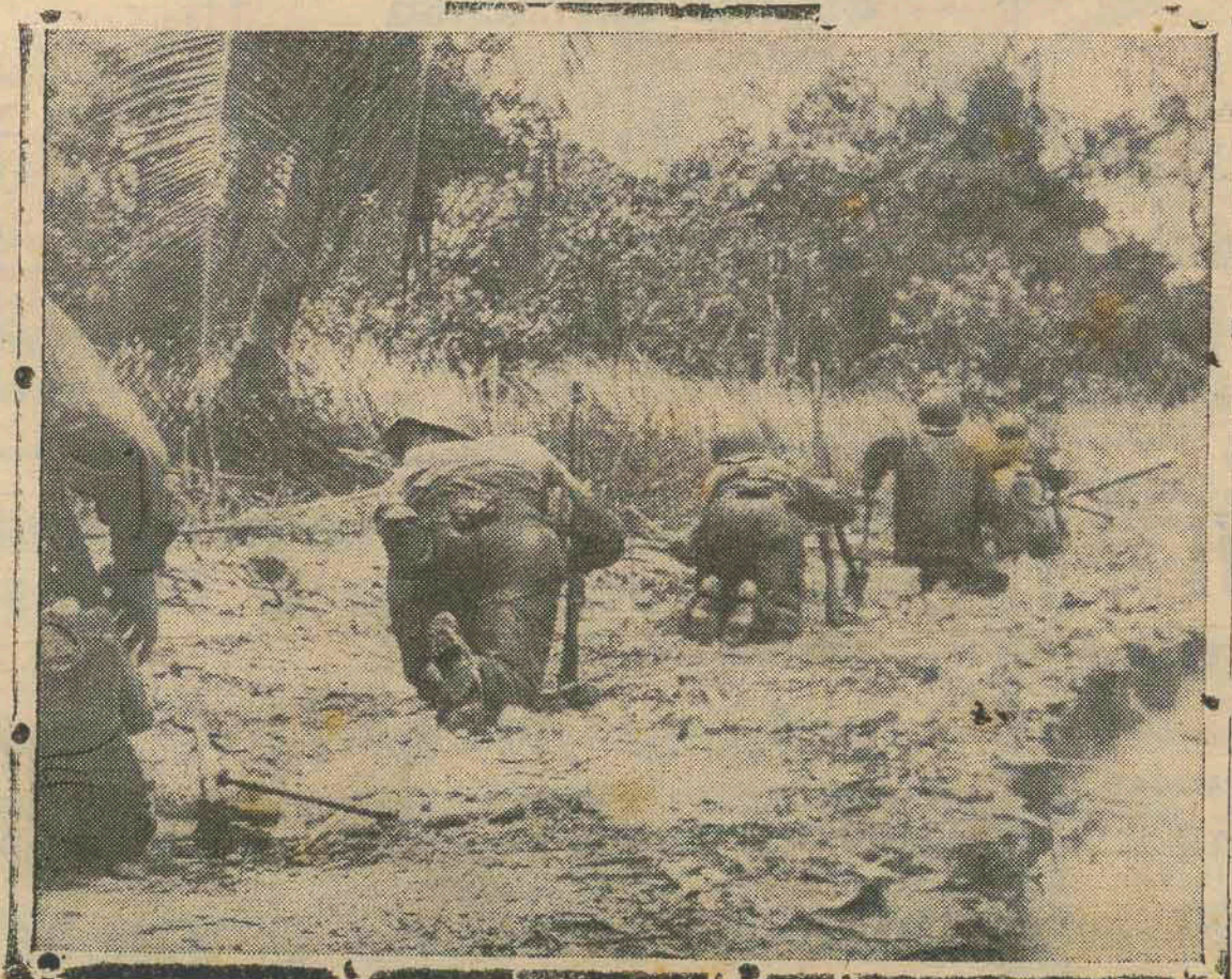
SOLDADOS NORTE-AMERICANOS, AVANÇANDO NAS DENSAS FLORESTAS DE NOVA GUINÉ SOB O COMANDO DE MAC ARTHUR

MELBOURNE, Junho — (Do Australian Information Service para Interaliado) — Anuncia-se que o primeiro batalhão constituido por forças das ilhas Fidji chegou recentemente a uma zona de combate do Pacifico. O batalhão partiu das ilhas há algumas semanas, realizando assim uma grande ambição dos habitantes das ilhas Fidji de defender o Reino Unido Britânico, a que pertencem.