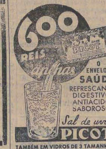
TAMBÉM EM VIDROS DE 3 TAMANHOS

Inofensivo ao organismo. Agradavel como um licor. Aprovado como auxiliar no tratamento da Sífilis e Reumatismo da mesma origem pelo D. N. S. P., sob o n. 26, de 1916