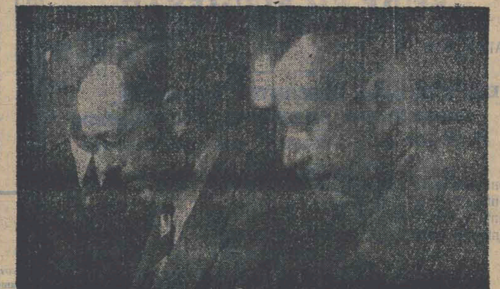
Outro aspecto da visita do sr. Interventor Federal, ás "Industrias Reunidas Jaraguá S. A."

Não estacionou, entretanto, a iniciativa das "Industrias Reunidas". Devidamente consolidados estes ramos da sua atividade e com a sua reputação consolidada no mercado consumidor, eis que adireção das "Industrias Reunidas" volta as suas vistas para mais um ramo de atividade, promovendo no momento e fadado a dar incentivo a mais uma nova industria. Trata-se da extração da cafeina do mate.