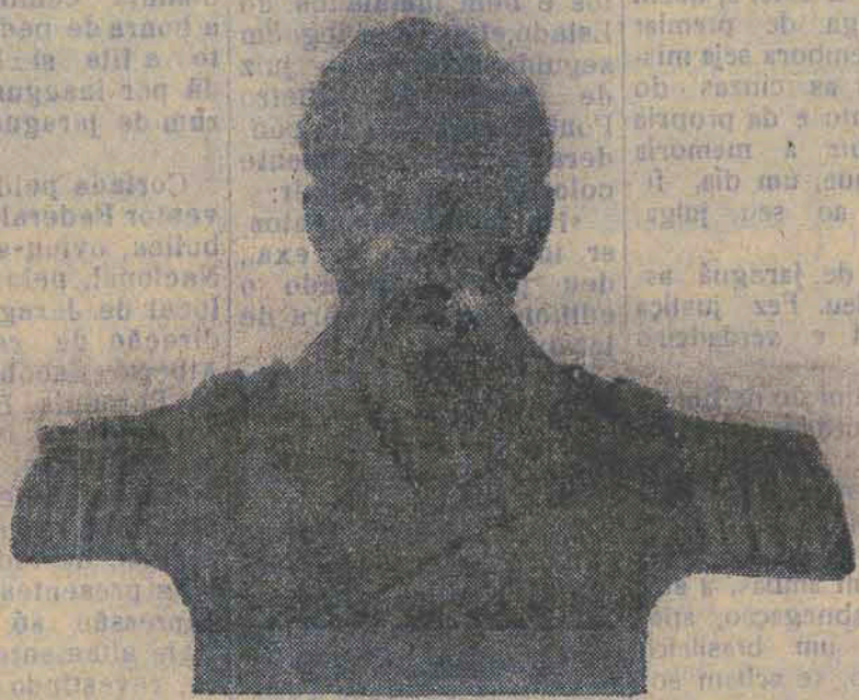
A herma do grande bandeirante

Finda a guerra, voltou ao Brasil como primeiro tenente e o peito condecorado de medalhas, algumas concedidas por governos estran-