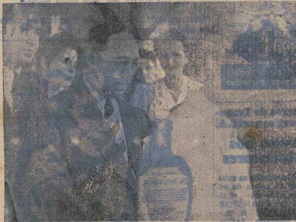
Um aspecto da visita do sr. dr. Interventor Nereu Ramos ao estabelecimento Gosch Irmãos.

Recebidos pelos diretores e socios do importante estabelecimento fabril jaraguense, os dignos visitantes percorreram todas as dependencias da fabrica. Colhen-