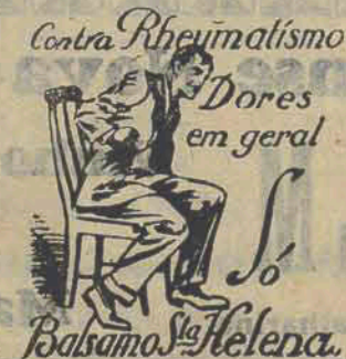
Contra Reumatismo Dores em geral Balsamo Helena