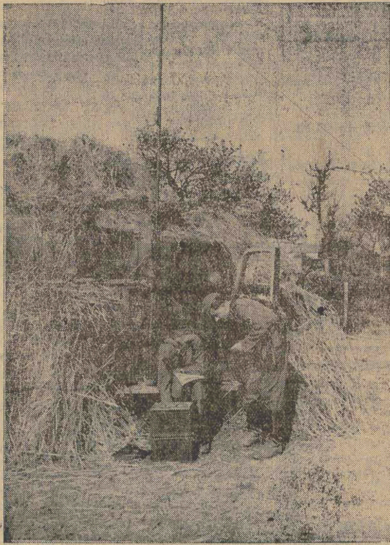
Uma estação de radio alemã, camouflada

O achado foi encontrado atrás das paredes recentemente revolvidas de sua casa de campo, situada nos Pyreneos. E, segundo a policia, foram encontrados valores orçados em mais de 500 milhões de francos, em sua maior parte em barras e moedas de ouro, além do bonus.