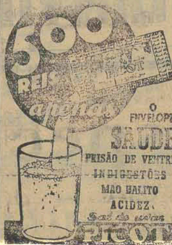
Tambem em vidro de 3 tamanhos