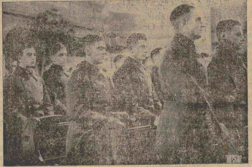
Soldados alemães assistindo a missa na historica "Garrison-Kirche" de Berlim.