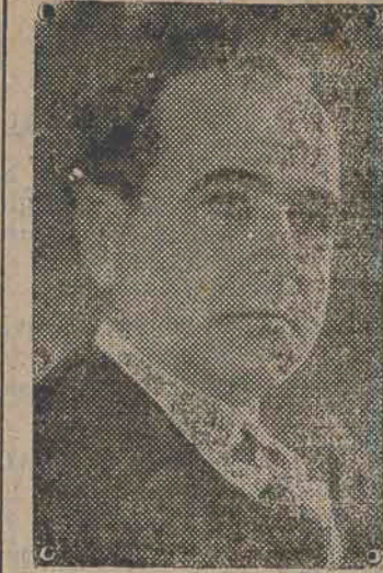
Presidente Getulio Vargas

Para a collocação de artigos americanos no mercado brasileiro.