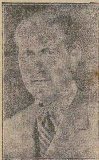
Sr. Osvaldo Aranha