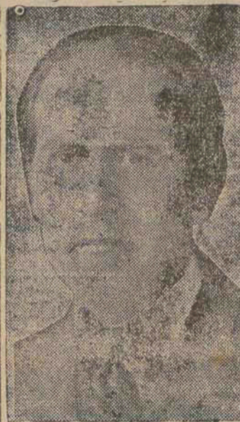
Sr. Oswaldo Aranha

Washington. O presidente Roosevelt enviou um telegramma ao presidente Getulio Vargas, convidando o ministro Oswaldo Aranha a vir a Washington para tratar de assumptos de alta importancia para os dois paizes. O presidente Getulio Vargas respondeu dizendo que o chanceller brasileiro