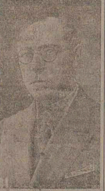
Dr. Nereu Ramos

lem pelo trabalho que realizam. E realizar é construir. Esse decerto tem sido o lema dos nossos poderes municipais.