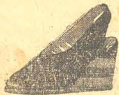
98,00 em camurça bordô, salto de cortiça