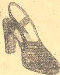
90,00 em pelica preta e azul, em bufalo branco, camurça preta e azul 98,00