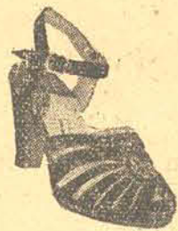
98,00 em fina camurça preta, azul e bordô salto 6 1/2