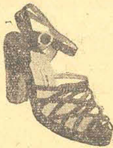
98,00 em camurça, bordô preto e branco, salto 6-7 cent. Salto carioca 95,00 em branco e bordô