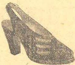
95,00 em fina camurça, azul marinho bordô e preto salto Luiz XV-4-6-7 cent.