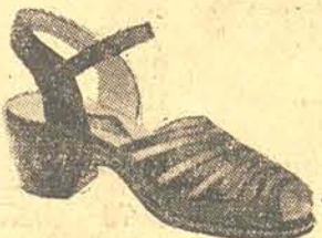
75,00 em pelica beije, com guarnições vermelho sangue