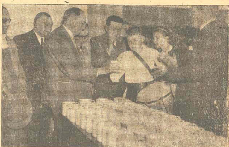
A SOPA ESCOLAR NO GRUPO «CASTRO ALVES»