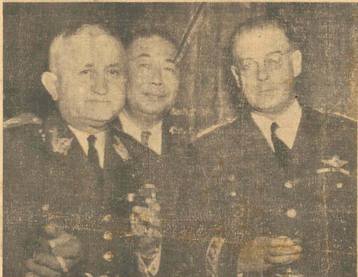
Quando da chegada ao Rio das vitoriosas Forças Expedicionárias Brasileiras, o major-brigadeiro Eduardo Gomes esteve no Palácio do Ministério da Guerra, apresentando cumprimentos ao general Eurico Gaspar Dutra, organizador da FEB. No clichê acima aparecem os dois ilustres militares, que são também candidatos à Presidência da República. E entre ambos, s. ex'cia., o Embaixador da China.

De todos os pontos do país ainda chegam centenas de telegramas, comunicando a instalação de escritórios, formação de núcleos, etc., indo com o objetivo de apoiar a mesma candidatura.