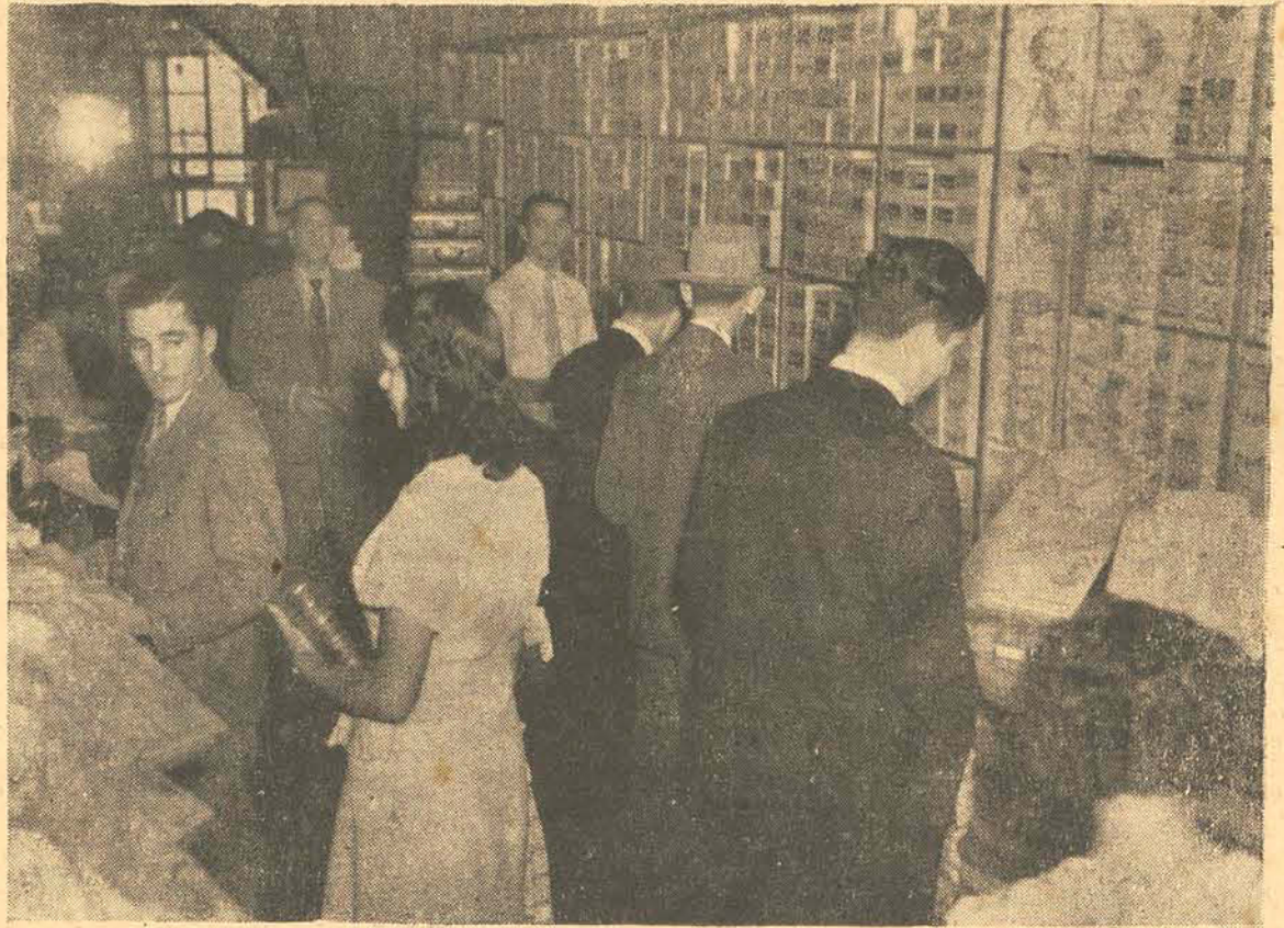
A "A Gazeta", ao registrar o acontecimento, cumprimenta a direção da conhecida casa comercial, e faz votos pelo seu crescente e ininterrupto progresso.