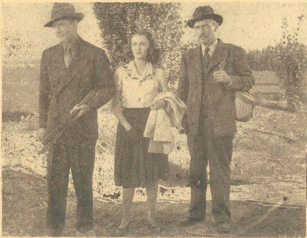
ERROL FLYNN, PAUL LUKAS e JEAN SULLIVAN, numa cena do filme Tres Dias de Vida