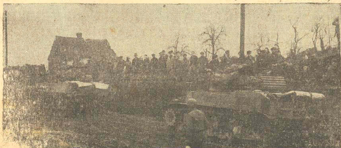
As forças norte-americanas passam por uma estrada na Alemanha no seu avanço sobre Colônia sob os olhares curiosos de civis alemães.