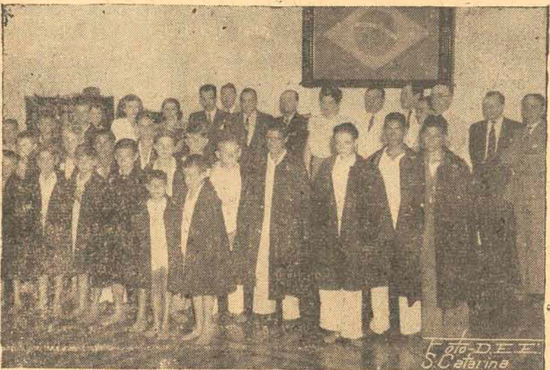
Já com os abrigos os jornaleiros posam para o f. t. g. r. a. f. o