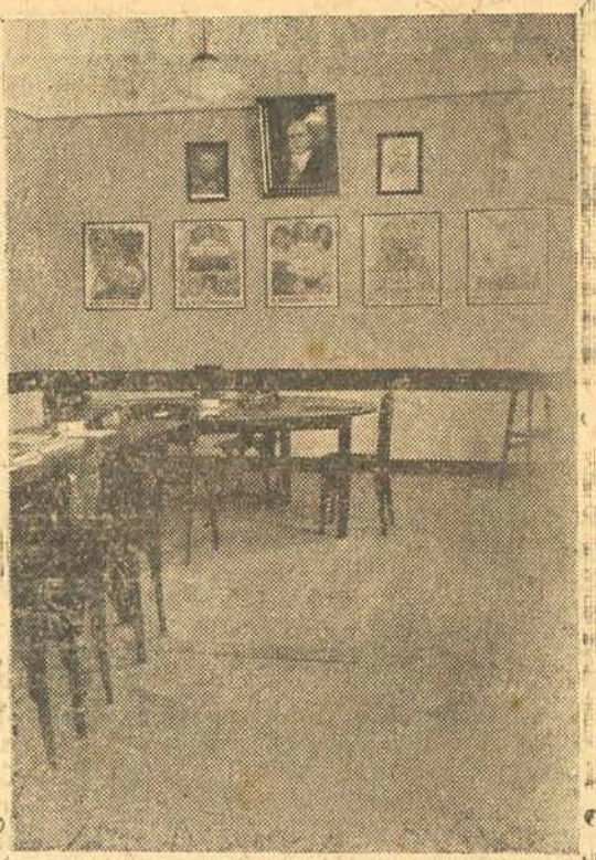
Salão de refeições