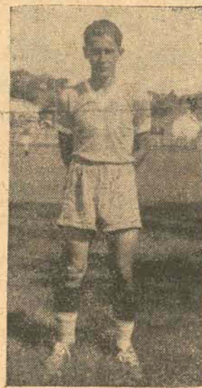
Vemo-lo, acima, uma fotografia tirada em 1940, convergendo a camiseta alvi celeste.

O MIGNON ponteiro canhoto do AVAI é, sem duvida, o mais completo goleador catarinense.