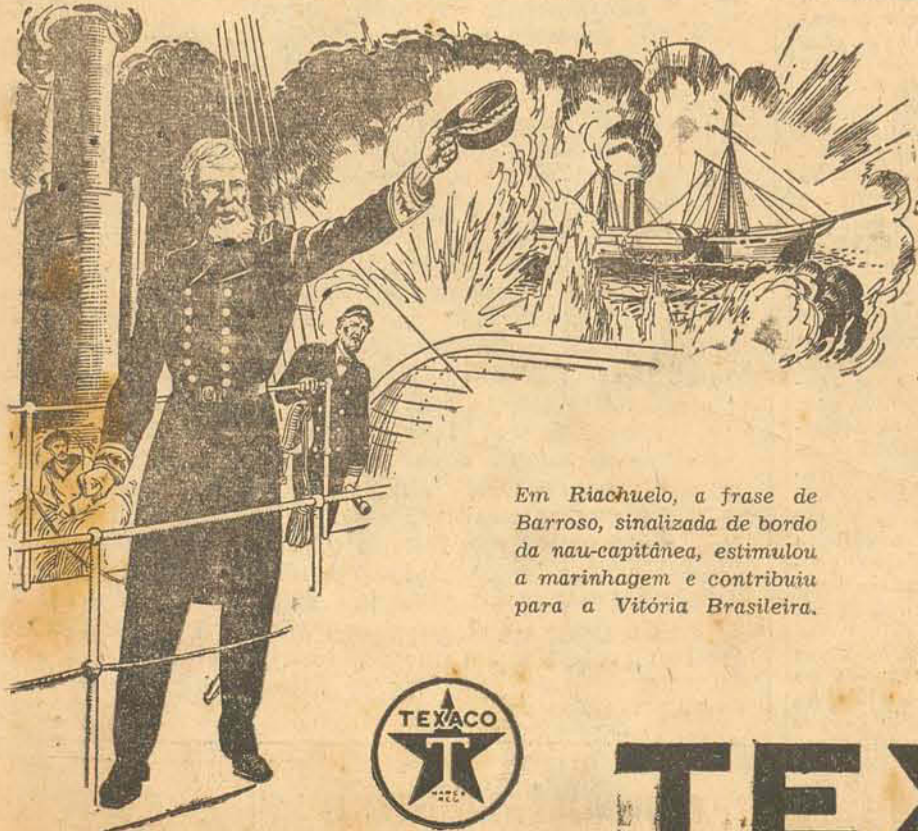
Em Riachuelo, a frase de Barroso, sinalizada de bordo da nau-capitânea, estimulou a marinagem e contribuiu para a Vitória Brasileira.

Uma casa no Estreito na rua 24 de Maio N. 786, com 18 metros de frente, fundos para o mar. A tratar na mesma localidade, a rua 7 Setembro N. 407