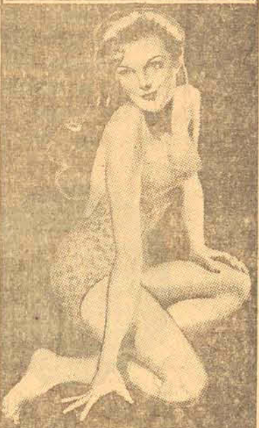
ILUSTRAÇÃO —alma da— propaganda impresa